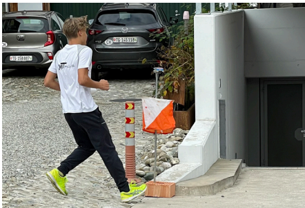
Orientierungslauf des Zyklus 3