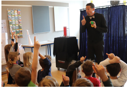
Projektwoche des Zyklus 1