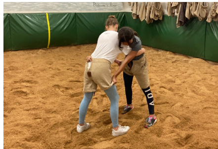
Sonderwoche im Schwingkeller im Zyklus 3