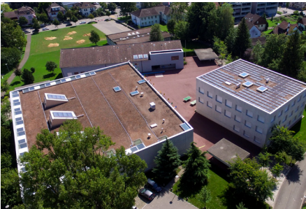
Sekundarschulhaus A, B + 3-fach Turnhalle