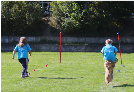
Sporttag des Zyklus 1

Die Schulverwaltung mit den Abteilungen Administration und Finanzen unterstützt die Behörde und Schulleitung.