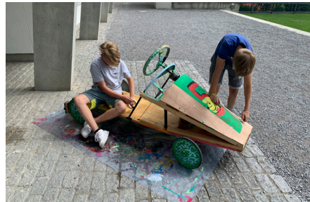
Projektwoche des Zyklus 2