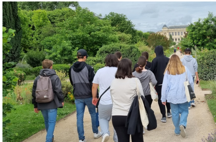
Kulturreise nach Paris der 9. Klasse